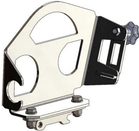
Rysunek 1 - Widok ogólny